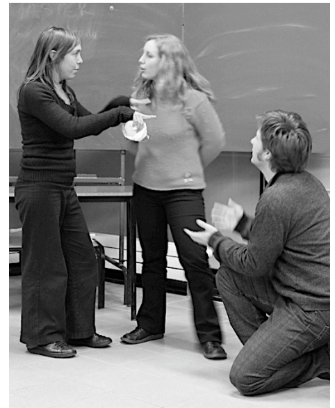
Dynamique du 27 janvier : mise en scène de situations d'enseignement

3 février. Nous sommes finalement arrivés à la conclusion que l'éducation populaire revêt nécessairement un aspect révolutionnaire dans le sens où elle implique une transformation des modalités de construction des connaissances et, par la même occasion, une transformation des relations sociales à visée émancipatrice. L'aspect politique de l'éducation populaire a été mis en évidence à travers la présentation d'expériences éducatives latino-américaines, discutées à la suite de la projection de quelques matériaux audiovisuels (sur le Salvador et le Mexique). Nous sommes finalement parvenus à deux accords de nature différente. Le premier consiste à dire que la distinction entre l'éducation populaire et l'éducation officielle repose sur la distinction entre l' être (action constitutive de l'individu et du groupe) et l' avoir (possession et distribution du savoir). Le deuxième accord nous donnait pour devoir la création d'une ou plusieurs chansons reflétant les principes de l'éducation populaire et excluant les concepts-clés que nous avons mobilisés tout au long de l'atelier... Pari tenu !