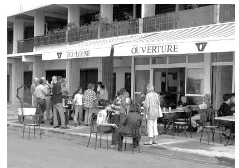
TO7.

désormais plurinational. Le débat nous a amené à considérer le défi que représente l'établissement d'un système d'éducation publique respectueux des identités culturelles dans un pays qui comprend plus de 30 groupes ethniques. Si le projet d'une « éducation communautaire » voulu par le gouvernement que dirige Evo Morales implique théoriquement un renversement de la relation entre le peuple et l'Etat, il n'en reste pas moins que les tensions entre les dynamiques imposées par le haut et les processus pédagogiques et territoriaux impulsés par le bas existent toujours.